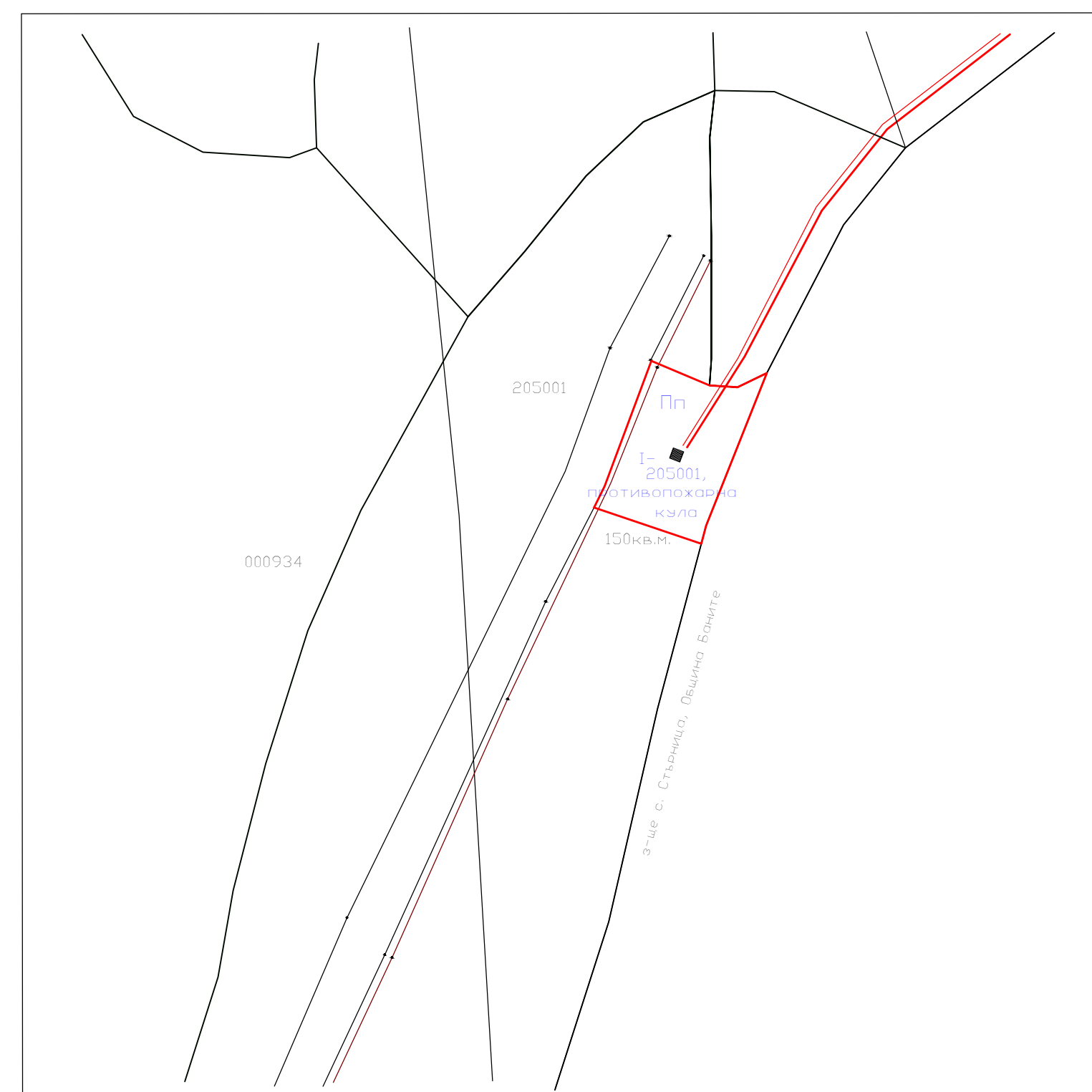
ПУП - План за регулация за образуване на УПИ I-205001, противопожарна кула по КВС на с. Манастир, Община Лъки за обект: "Изграждане на интегрирана система за ранно известяване на горски пожари с автоматична наблюдателна станция"