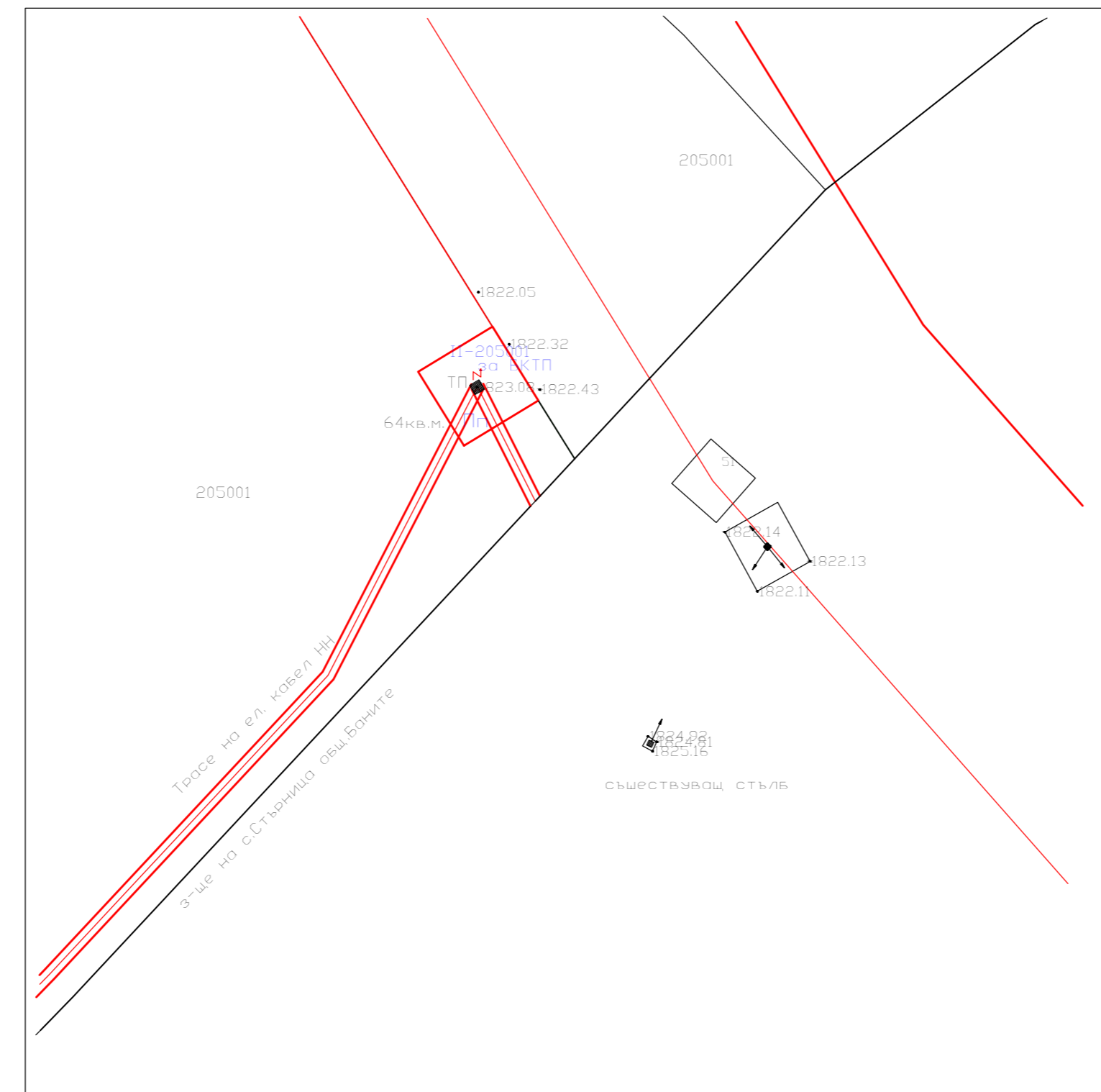
ПУП - План за регулация за образуване на УПИ II-205001, за БКТП по КВС на с. Манастир, Община Лъки за обект: "Изграждане на интегрирана система за ранно известяване на горски пожари с автоматична наблюдателна станция" М 1 : 500